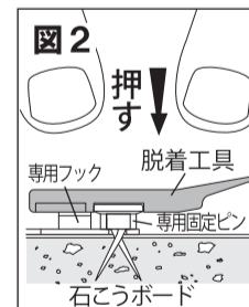
専用固定ピンの先端は石こうボードの中で開く仕様になっております。