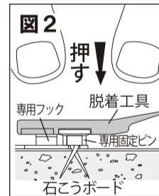
専用固定ピンの先端は石こうボードの中で開く仕様になっております。