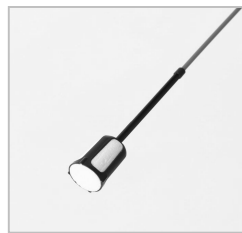
写真③ 水位計パーツ内の浮き。

・水位計の赤い棒もしくは浮きが内側で引っかかっている場合があります。水位計パーツを軽くたたくことで直ります。軽くたたいても改善しない場合は、パーツ上部のキャップ(写真⑤左端)を外して、赤い棒を引っ張って引っかかりを直してください。