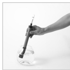
写真④ 水位計パーツを水に浸すと、水位を示す赤い棒が上下します。