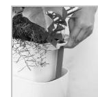
ワイドタイプ ミディアム

※急に引き上げると白い枠部分がはずれる可能性があります。静かに引き上げてください。