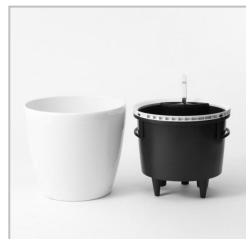
写真① レチューザは、水をためる外側の鉢(左)と、植物を植える内側の鉢(右)とに分かれています。