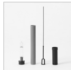
写真⑤ 水位計のパーツは、お手入れの際に簡単に分解することができます。