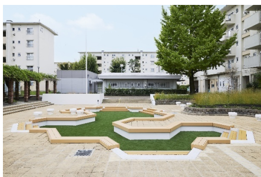
中宮第3団地「プール跡ひろば」

完成にあたり、中宮第3団地においてお披露目イベントを開催いたします。このイベントは、これまで地域の一員として中宮第3団地のプロジェクトにおいて使われ方検討及びデザイン提案、DIYなどの改修を行った大阪電気通信大学の学生が、取り組みへの想いや学びについて生の声でお伝えするほか、地域で活動される皆さまにもご参加いただく予定です。ご多忙の中誠に恐縮ですが、ぜひご取材賜りますようご案内申し上げます。