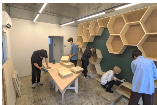
中宮第3団地での学生によるDIYの実施

今回のリノベーションは、団地共用部を現代の暮らしにあった形に再生・活用することをテーマに、地域の皆さまに参加いただく形で進めてまいりました。具体的には、その検証を目的としたイベントなどの開催を重ね、地域の皆さまのご意見を伺い、コミュニティ活動やコミュニティ拠点の在り方を検討するとともに、共用部の改修などに生かす活動「～となりのひろば～」を通じて、地域活性化およびリノベーションに取り組んできました。