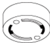
丸形引掛シーリング